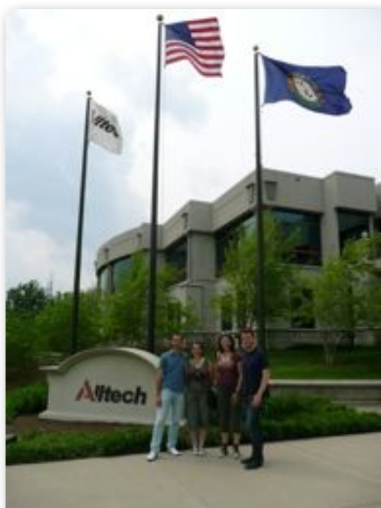
La Promotion 2010-2011 devant le siège d'Alltech, après une visite des installations