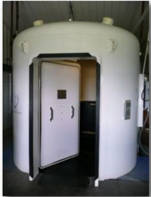
Caisson basse pression pour l'oxygénation des tissus