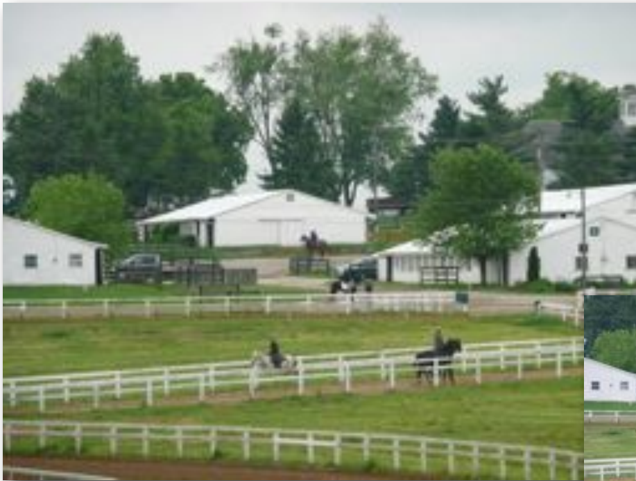
Centre d'entraînement pour pur sang