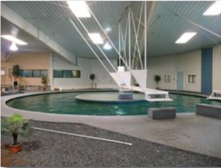
Bassin d'aquathérapie pour chevaux