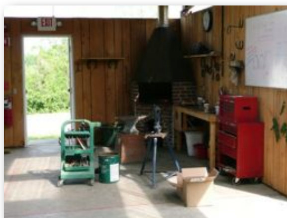
Kentucky Horse Shoeing School