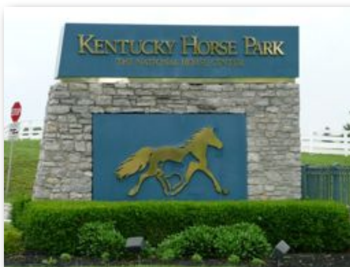
Kentucky Horse Park