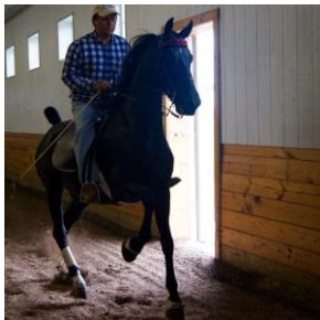
Etalon saddlebred, CornerStone Farm