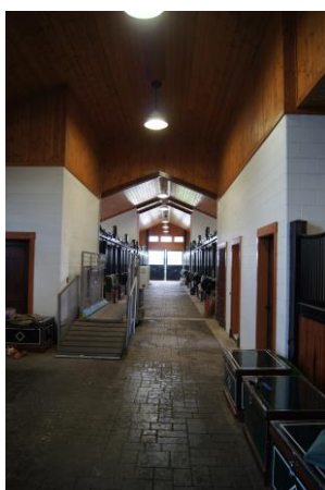
SPY COAST FARM