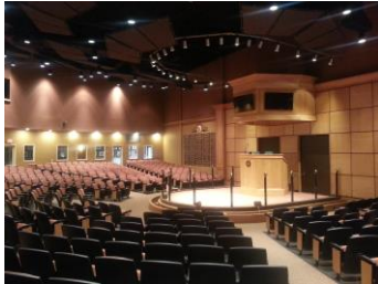
Salle des ventes de Fasig Tipton