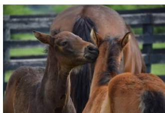
Poulains Quarter Horse, élevage Chuck Givens