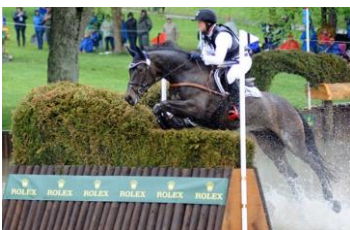
Michael Jung et FischerRocana FST