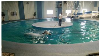
Piscine au KESMARC