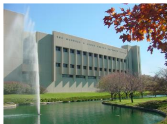
Gluck Equine Research Center