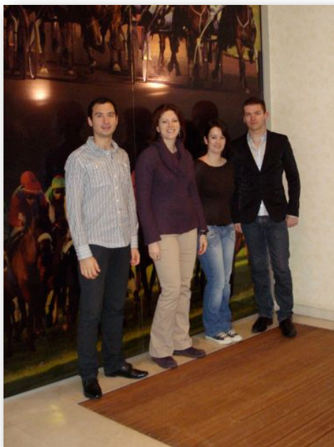
Les étudiants du MESB dans les studios de la chaîne Équidia

Le circuit du sport a donc été étudié dans son entièreté : des jeunes chevaux aux moins jeunes et à leurs cavaliers, sans oublier les directives politiques prenant place dans cet ensemble.