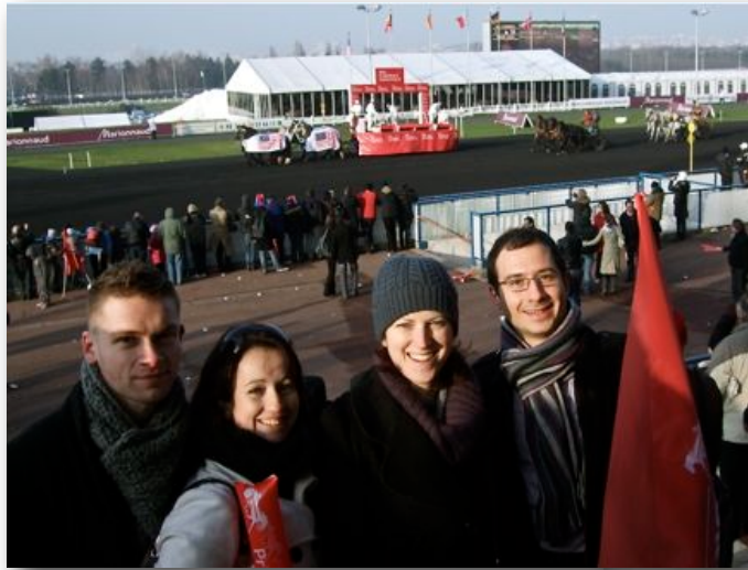
Les étudiants à l'Hippodrome de Vincennes à l'issue du Prix d'Amérique

Les étudiants se sont aussi essayés aux paris...Résultats : deux gagnants sur trois joueurs... Une expérience concluante ! Un très grand MERCI à la Société d'Encouragement du Cheval Français !